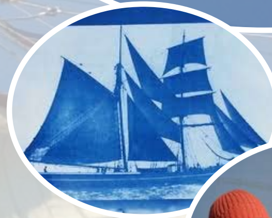
links: Fotoafdruk in cyanotype onder: Fotograaf Andris Koslovski

Het Veenkoloniaal Museum te Veendam organiseert in samenwerking met museum Kapiteinshuis Pekela een expositie aan boord van de Tromp. De oude handelsrelaties die de Groninger Veenkoloniën met de landen rond de Oostzee onderhielden staan als vanzelfsprekend centraal. Daarnaast nodigen we de Letse fotograaf Andris Koslovski uit om op de Tromp mee te varen. Koslovski voer ook mee met de Volvo Ocean Race en maakte tijdens die reis prachtige foto's die hij met de oudste fototechniek rechtstreeks op papier afrukt. Zijn fotoverslag is na afloop van het project op diverse locaties te zien en kan ook in uw bedrijf worden ondergebracht.