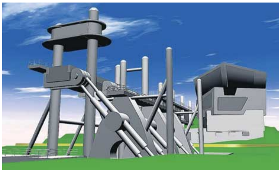
So könnte eine Art Schiffshebewerk nahe der unvollendeten Schleusentreppe Wüstenzsch einmal aussehen. Grafik: Dirk Becker/Saale-Elster-Kanal-Förderverein

„Die erste Etappe der Machbarkeitsstudie zeigt eindeutig, dass die Idee weiter verfolgt werden sollte“, so Rosenthals Zwischenfazit. Die Ergebnisse zeigten, dass eine Realisierung für den gesamten Raum zwischen Halle und Leipzig „ganz erhebliche Potenziale“ hätte, die man einfach nicht negieren könne. „Mit einer schiffbaren Verbindung sowie einem – notwendigen – Schiffshebewerk würden wir eine einmalige Attraktion erhalten, die laut der Planer 500 000 Gäste pro Jahr in die Region locken würde“, so der Dezernent.