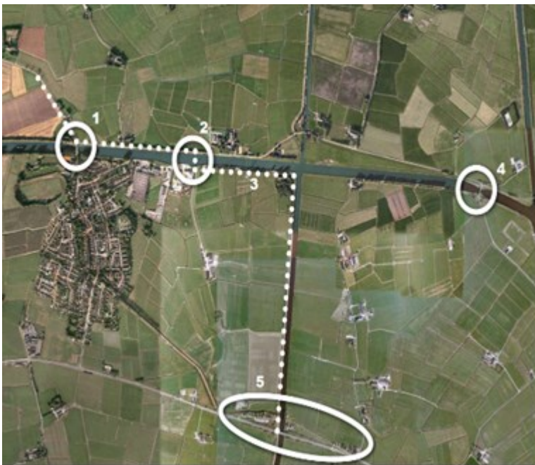
Afbeelding 1: overzicht projectonderdelen planuitwerkingsbesluit